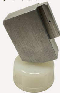
0024 グルーピングノズル