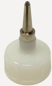
0003 ユニバーサルノズル