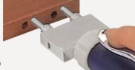
0012,0013 ダボノズル3本タイプ