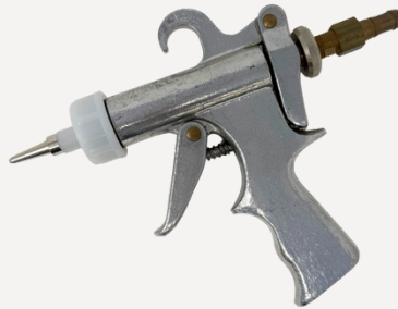
9902 ピストル型グルーガン