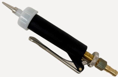
0002 標準型グルーガン