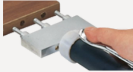
0012,0013 ダボノズル3本タイプ