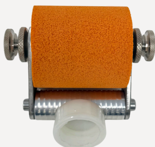
0034,0035,0036 スポンジローラーノズル